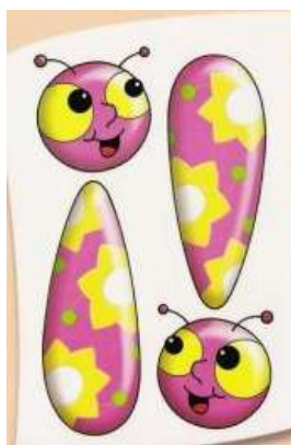
Signos de exclamación