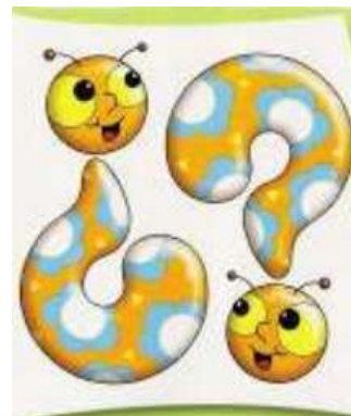
signos de interrogación